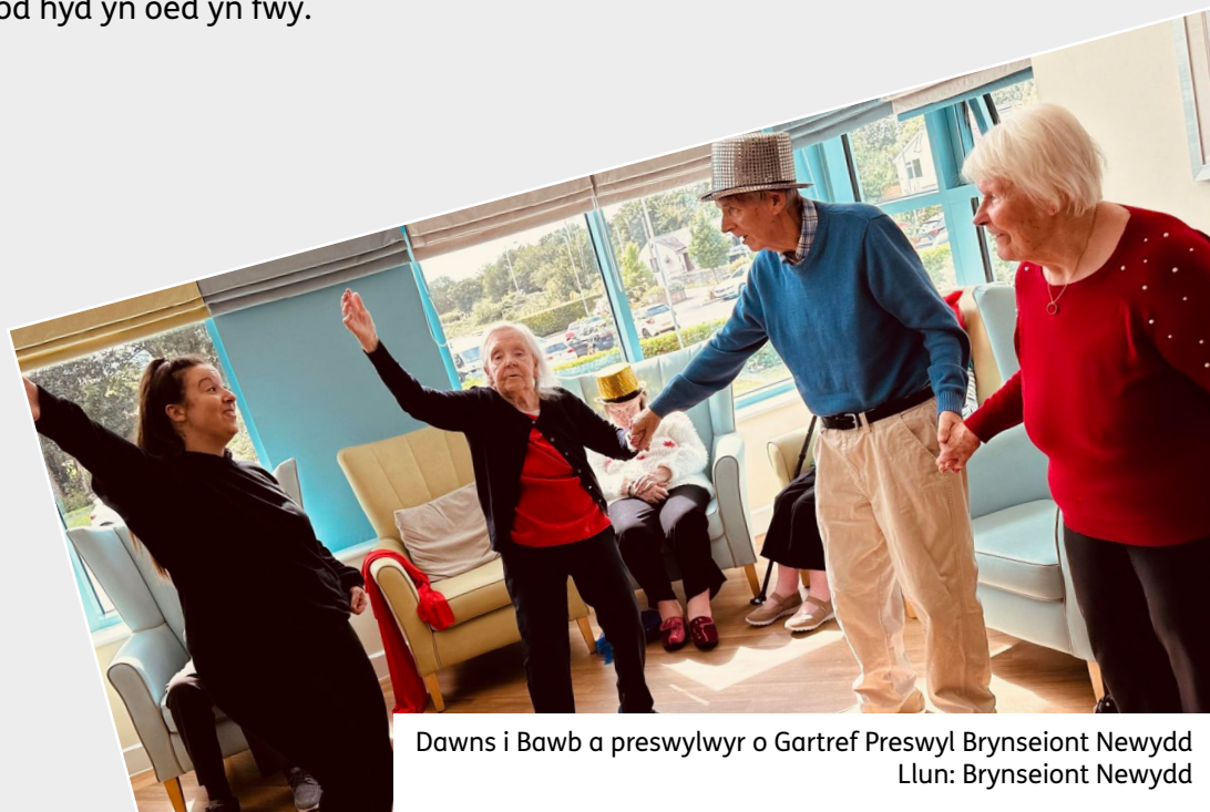
Dawns i Bawb a preswylwyr o Gartref Preswyl Brynseiont Newydd

Mae ein hastudiaeth o'r ffordd y mae buddion economaidd a swyddi'n cael eu cynhyrchu gan wahanol fathau o sefydliadau celfyddydol yn dangos bod yr enillion mwyaf mewn effaith economaidd (GVA) a chyflogaeth yn debygol o gael eu gwneud trwy fuddsoddiad cynyddol mewn sefydliadau canolig eu maint, gyda grantiau yn y £100,000 - £250,000, felly yn dibynnu ar ble y caiff unrhyw arian ychwanegol ei wario, gallai'r elw economaidd fod hyd yn oed yn fwy.