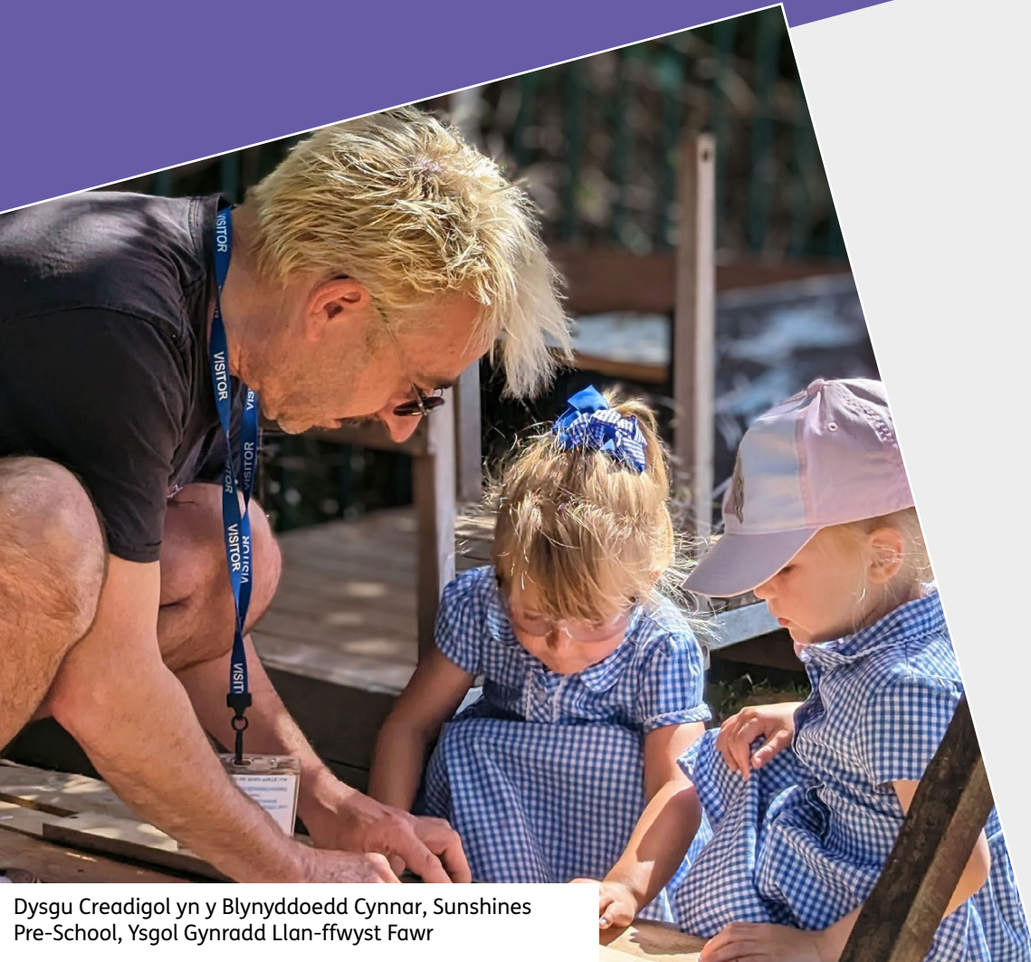
Dysgu Creadigol yn y Blynyddoedd Cynnar, Sunshines Pre-School, Ysgol Gynradd Llan-ffwyst Fawr

Mae ein rhaglen Dysgu Creadigol yn cefnogi ysgolion, dysgwyr, ac athrawon ac mae wedi darparu dros 140,000 o gyfleoedd dysgu ers 2015. Mae'r rhaglen hefyd wedi darparu dros 4,600 o gyfleoedd i athrawon gefnogi eu dysgu proffesiynol.