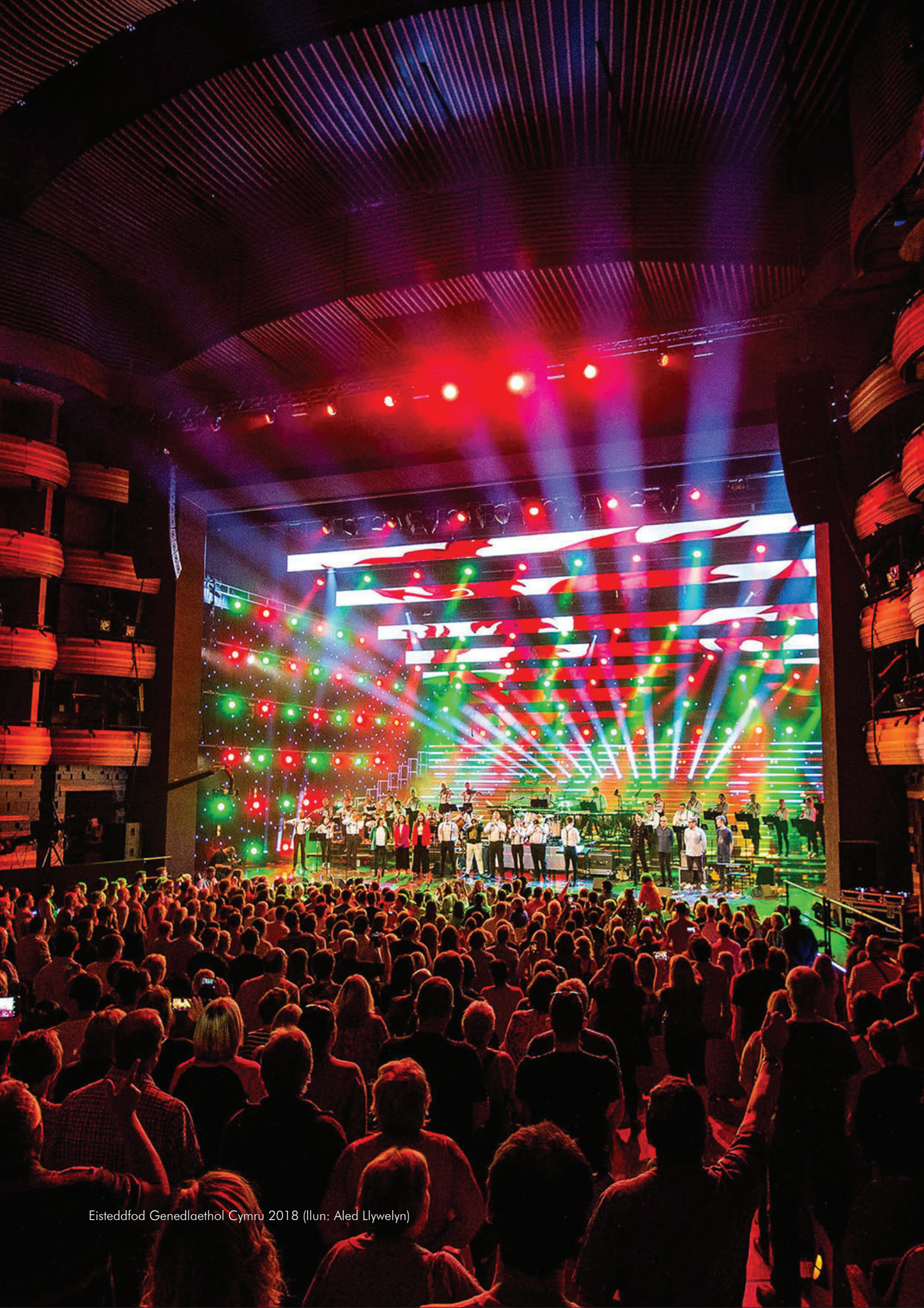
Eisteddfod Genedlaethol Cymru 2018